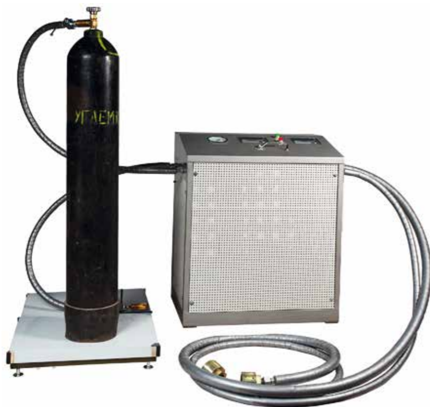
Станция зарядная углекислотная СЗУ-500 и СЗУ-500Д.

Станция зарядная углекислотная СЗУ-500 предназначена для: контроля массы баллонов, подлежащих заполнению, наполнения баллонов жидкой двуокисью углерода (CO 2 ) с весовым дозированием, наполнения углекислотой баллонов систем пожаротушения и огнетушителей, наполнения углекислотных моноблоков на 6...12 баллонов с весовым дозированием (весы под моноблоки поставляются по дополнительному заказу).